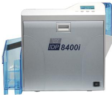
Der IDP8400i Re-Transfer Kartendrucker

Die Mitarbeiter-Ausweise wurden sukzessive von laminierten Papierausdrucken auf bedruckte Plastikkarten umgestellt und die Parkausweise bekamen ebenfalls ein neues Layout.