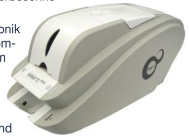
Der Smart Re-Write

Am Empfang der Murrelektronik können nun schnell und komfortabel die Plastikkarten im Re-Write-Verfahren personalisiert und ausgegeben werden. Die Karten werden als Sichtausweise mit Hilfe von Hartplastikhüllen und Metallclipsen an der Kleidung der Besucher befestigt. Am Ende des Aufenthaltes werden die Besucherausweise am Empfang zurückgegeben und können für weitere Besucher erneut personalisiert werden.